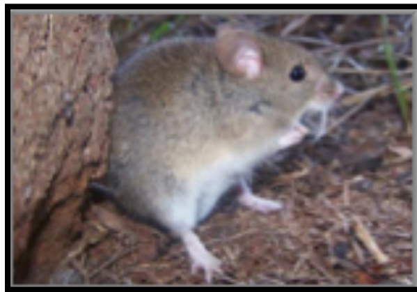
Figura 1. Especímen de C. callosus reservorio de MACV. Tomado de Bruckner, 2015 (2).

la pérdida de la biodiversidad y todas las acciones humanas que causan un desequilibrio ecológico hacen que cada vez se den más brotes de enfermedades zoonóticas y en algunos casos llegan a convertirse en epidemias, poniendo en riesgo principalmente a los pobladores de las comunidades colindantes con los ambientes silvestres, siendo estos los más desfavorecidos debido a la falta de acceso a los servicios de salud. Estas zoonosis son una amenaza para la salud pública.