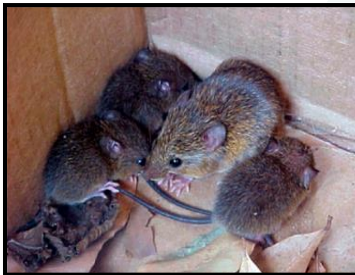
Figura 2. Especímenes de O. microtis . Tomado de Antunes et al., 2021 (10).